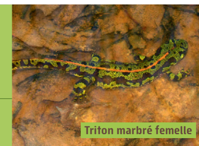
Triton marbré femelle