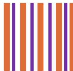
PARCELLE 2: 4 IR/4 avec une couverture végétale

Donc exploitation avec parcelle 1+2 = 3 IR/4 avec une couverture végétale = 75% = Niveau 1