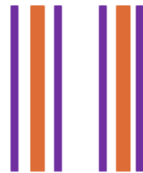
PARCELLE 1: 2 IR/4 avec une couverture végétale