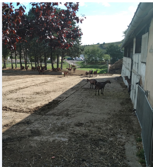
Un exemple d'aire bétonnée non couverte (= sans toit)