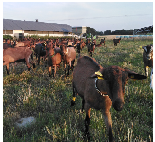
Un exemple d'aire d'exercice enherbée

Remerciements aux éleveurs qui ont répondu à l'enquête ainsi qu'à tous ceux qui ont contribué à cette étude.