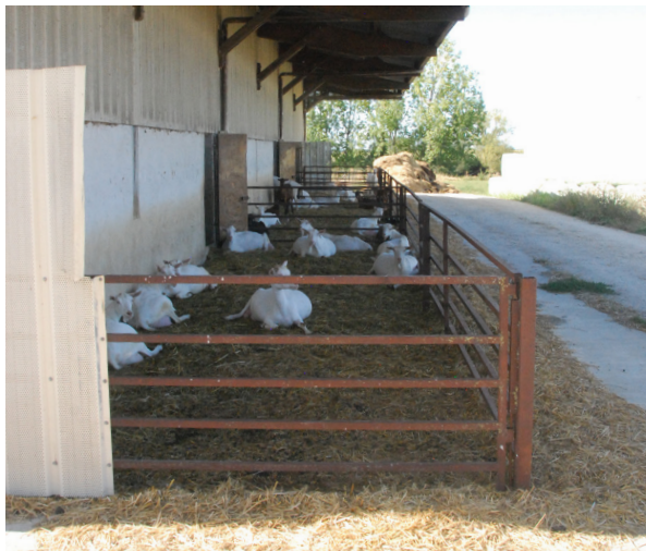
Un exemple d'aire bétonnée couverte (= avec un toit)

Le choix de l'emplacement de l'aire permet aux chèvres un accès libre à l'extérieur via une ou plusieurs ouvertures depuis la chèvrerie. C'est une solution durable , mais relativement onéreuse au vu des travaux mis en œuvre (terrassament, sol, toiture). Pour l'exemple observé, la surface allouée par chèvre (environ 1 m 2 ) et un curage régulier semblent suffisants pour un fonctionnement correct de l'aire.