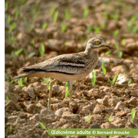
œdicnème adulte

Une quinzaine de jours après l'éclosion des œufs, les piquets et le jalon sont retirés. Les jeunes quittent rapidement le nid et les adultes s'occupent d'eux pendant environ six semaines. Les bénévoles assurent le suivi des différentes nichées. L'agriculteur est informé de l'issue de la reproduction.