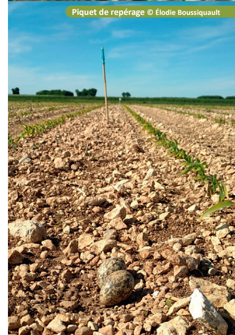
Piquet de repérage