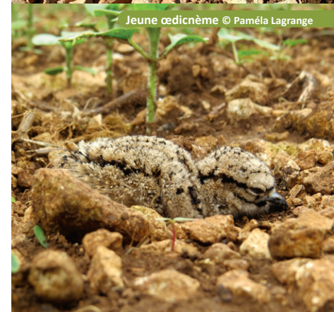
Jeune œdicnème