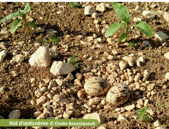
Nid d'œdicnème

Migrateur partiel, l'œdicnème criard est surtout observé dans notre région de fin-février à novembre. Plus couramment nommé « Courlis de terre », cet oiseau apprécie les milieux ouverts et caillouteux.