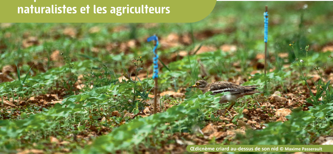
Œdicnème criard au-dessus de son nid

Suivi et protection : un partenariat entre les associations naturalistes et les agriculteurs