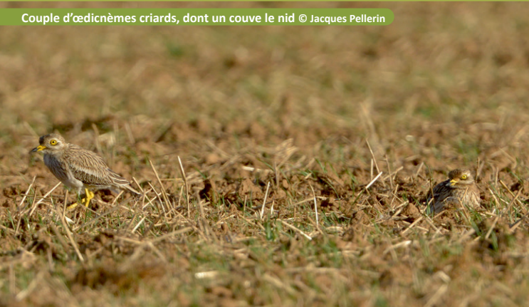
Couple d'œdicnèmes criards, dont un couve le nid

Lors des travaux agricoles, la présence d'un nid peut être décelée lorsqu'un ou deux adultes s'éloignent tardivement à l'approche du tracteur. Ce type de comportement est un indicateur de la présence d'œufs ou de jeunes poussins.