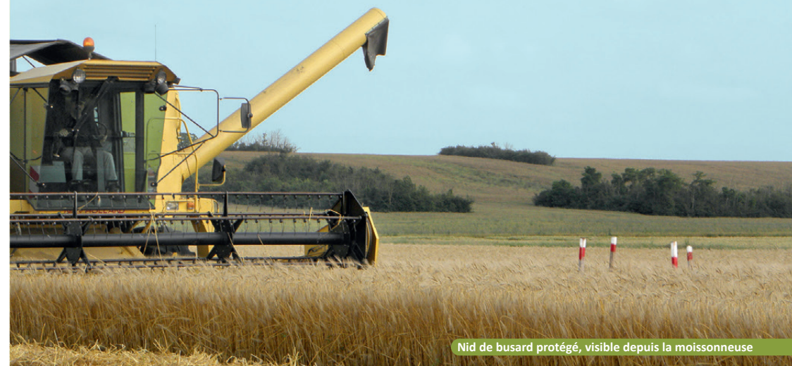
Nid de busard protégé, visible depuis la moissonneuse

Suivi et protection dans la Vienne par la LPO et les agriculteurs