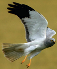
Mâle de busard Saint-Martin

Le busard Saint-Martin est présent toute l'année, le busard cendré est migrateur, il arrive dans notre région mi-avril.