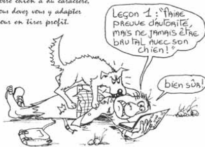
Illustration d'Alain CHRETIEN

Votre chien a du caractère, vous devez vous y adapter pour en tirer profit.