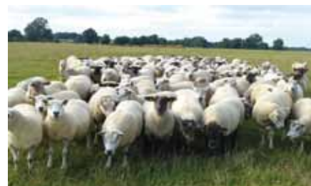
Brebis prêtes pour la mise en lutte

Attention : les brebis luttées « sur le lait » sont moins fertiles que les brebis ayant produit la saison précédente et taries à la mise en lutte.