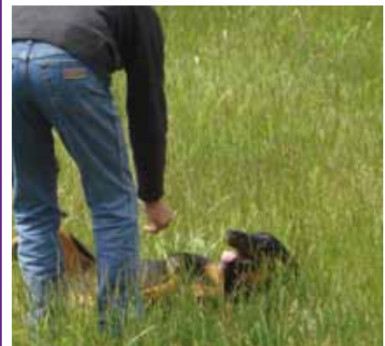
Test de caractère en cours (permet de voir le niveau de soumission, de dépendance à son maître, de sensibilité, et si le chien est stable, équilibré, sociable, tonique, rancunier...).

Mais il est important de faire attention au caractère des parents avant de choisir un chiot pour ne pas tomber dans des situations conflictuelles par la suite. Par exemple, un maître avec une forte autorité naturelle doit éviter de choisir un chiot avec un risque de sensibilité élevée. Le chien risque de fuir si le ton monte trop haut. A l'inverse, une personne sans trop d'autorité ne devra pas avoir un chien trop « fort », qui demande plus de fermeté pour le canaliser.