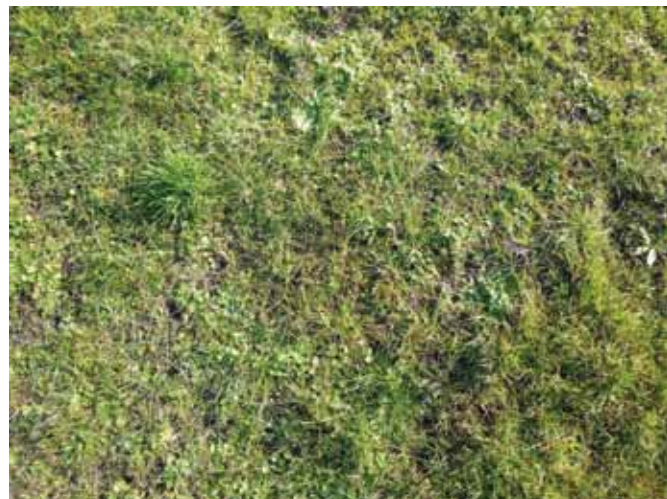
Prairie râpée suite au pâturage d'ovins

Les ovins, de part leur tendance à pâturer au plus proche du sol, en utilisant leurs lèvres et en procédant par cisaillement, favorisent des espèces rampantes telles que l'agrostide stolonifère ou l'achillée millefeuille. Ainsi, les prairies pâturées par les moutons auront une morphologie gazonnante, d'une qualité fourragère moyenne."