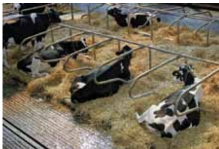
Le réglage des logettes : un point clé du bien-être des animaux

ont du mal à se lever, les logettes sont mal adaptées. Un arrêtoir au sol situé à 1,85 m du seuil de la logette convient à la majorité des troupeaux. La barre au garrot doit être suffisamment avancée pour permettre un balancement de l'encolure lors du relevé, de même il faut prévoir un dégagement devant les logettes. Le couchage doit être confortable, en se laissant tomber à genoux, cela ne doit pas faire mal ! On évitera ainsi les problèmes de tarsites aux jarrets.