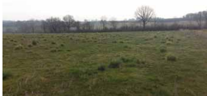
Prairie en touffes suite au pâturage de bovins

Les bovins vont favoriser des espèces à port dressé, formant des touffes et des espèces résistantes au piétinement. On peut dans ce sens citer la fétuque élevée, le pâturin commun ou les renoncules. Les prairies pâturées par les bovins sont donc plutôt à morphologie mixte (gazon et touffes). Ce qui vient du fait que les bovins pâturent en mouvement sans aller jusqu'au ras du sol. La formation de touffes est accentuée par les bouses autour desquelles les bovins ne pâturent pas, formant ainsi des zones de refus.