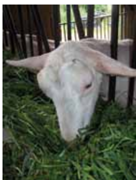
Chèvre en affouragement en vert