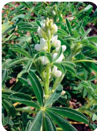
La graine de lupin apporte de l'énergie sous forme de lipides