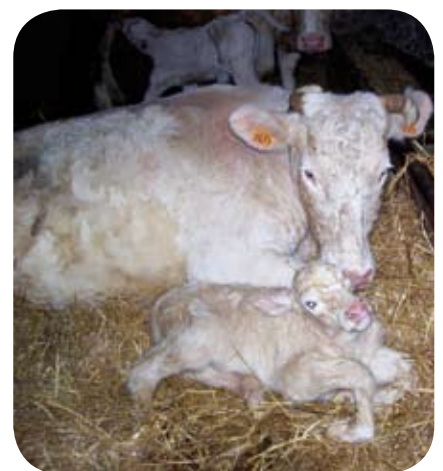
Hiver 2009 : Constat alarmant pour les vêlages

Dans un premier temps, il faut conserver un nombre de broutardes plus important dès cet automne et ceux à venir. Une attention particulière doit être portée sur la mise à la reproduction des génisses. N'hésitez pas à commencer la mise à la