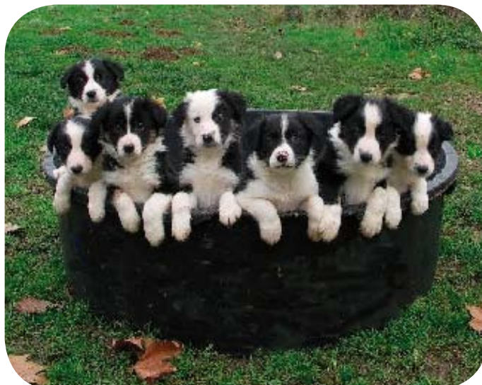
Choisir celui qui sera le compagnon de travail pour une dizaine d'année