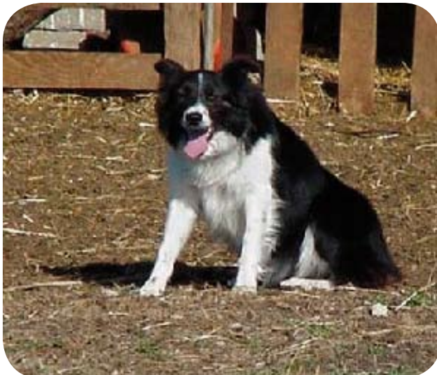
Le rôle du maître est de protéger son chien contre les risques éventuels.