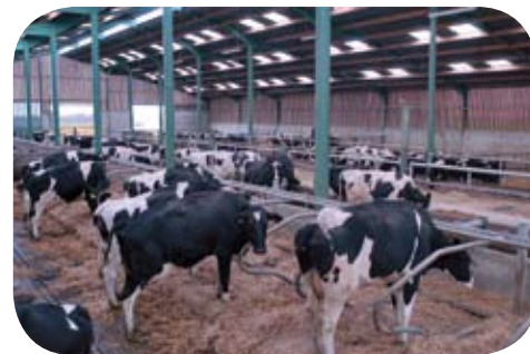
Rôle des Commissions : améliorer la situation cellulaire des troupeaux