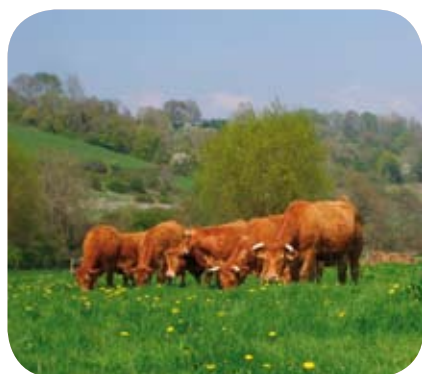
Des simulations sont faites sur les systèmes bovins limousins

Le «bilan de santé à mi-parcours» de la PAC conduit à de nouvelles modifications dans l'attribution des aides aux exploitations agricoles. Sa mise en œuvre essentielle aura lieu à partir de 2010. Les changements résultent à la fois de décisions communautaires et de choix nationaux qui sont maintenant connus dans leurs grandes lignes mais dont certaines modalités restent à préciser.